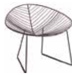
Slitta lounge Lounge sled Kufengestell Loungesessel Patin Lounge Luge Lounge スレッドラウンジ 雪橇式躺椅