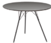
h 74 cm | 29 1/8"