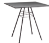
h 74 cm | 29 1/8"