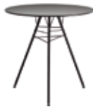
h 74 cm | 29 1/8"