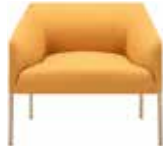
Poltrona 82,5 cm Armchair 82,5 cm Sessel 82,5 cm Butaca 82,5 cm Fauteuil 82,5 cm アームチェア 82,5 cm 是经