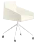
AC Trespole fisso Fixed trestle Fester Sternfuß Estructura fija Piètement fixe 固定柱脚 脚架固定式