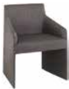
Guest ゲスト 宾客