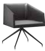
TR Trespole girevole Swivel trestle Drehbarer Sternfuß Estructura giratoria Piètement pivotant 回転柱脚 脚架旋转式