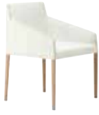
AC 4 gambe 4 legs Vierbeinig 4 patas 4 pieds 4本脚ベース 4腿