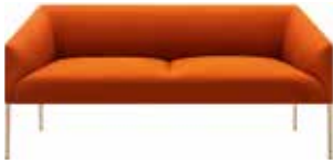
2 posti 2 seats 2 Sitze 2 plazas 2 places 2人掛 是经