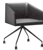
TR Trespole fisso Fixed trestle Fester Sternfuß Estructura fija Piètement fixe 固定柱脚 脚架固定式