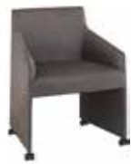
Guest ゲスト 宾客