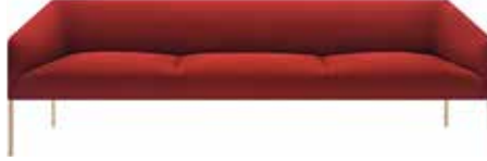
3 posti 3 seats 3 Sitze 3 plazas 3 places 3人掛 是经