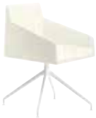
AC Trespole girevole Swivel trestle Drehbarer Sternfuß Estructura giratoria Piètement pivotant 回転柱脚 脚架旋转式