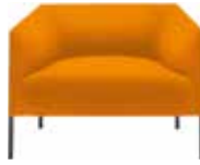
Poltrona XL 90 cm Armchair XL 90 cm Sessel XL 90 cm Butaca XL 90 cm Fauteuil XL 90 cm アームチェア XL 90 cm 是经