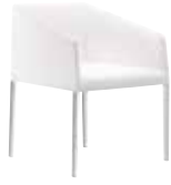
TR 4 gambe 4 legs Vierbeinig 4 patas 4 pieds 4本脚ベース 4腿