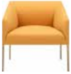
Poltrona 71 cm Armchair 71 cm Sessel 71 cm Butaca 71 cm Fauteuil 71 cm アームチェア 71 cm 是经