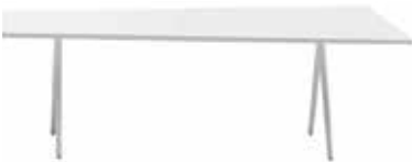
H 74 cm / 29 1/8" Piano trapezoidale Trapezoidal top Keilförmige Tischplatte Mesa trapezoidal Table trapézoidale 台形トップ 梯形