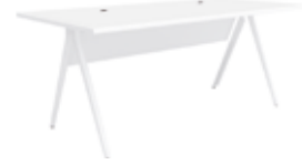
H 74 cm / 29 1/8" Office オフィス用トップ 公式椅面