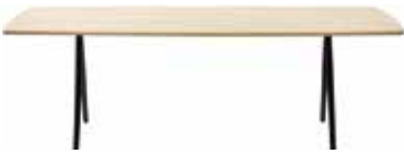
H 74 cm / 29 1/8" Piano e profilo a "saponetta" in legno "boat-shaped" wood top Abgeschrägten Tischplatte aus Holz Forma ovalada en madera Forme bombée en bois ソーバー形 (木製仕上げ) 肥皂形状 (木)