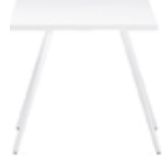
H 74 cm / 29 1/8" Piano quadrato Square top Quadratische Tischplatte Mesa cuadrada Table carrée スクエアトップ 方形