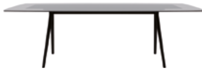
H 74 cm / 29 1/8" Piano a "saponetta" in vetro "boat-shaped" glass top Abgeschrägten Tischplatte aus Glas Forma ovalada en madera Forme bombée en verre ソーバー形 (ガラス仕上げ) 肥皂形状 (在玻璃杯中)