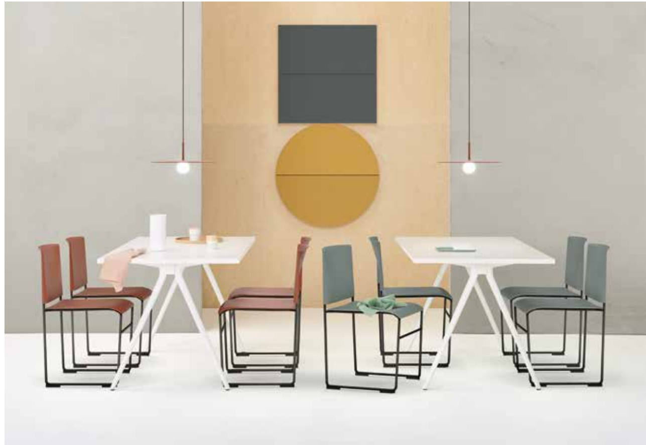
TOP • Cafeteria • Art. 5401; Art. 6600 Stacy; Art. 5100, 5102 Parentesit BOTTOM • Meeting room • Art. 5437, Art. 2055, 0230 Catifa 53; Parentesit composition