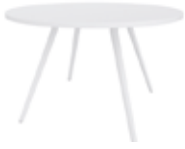
H 74 cm / 29 1/8" Piano rotondo Round top Runde Tischplatte Mesa redonda Table ronde ラウンドトップ 圓形